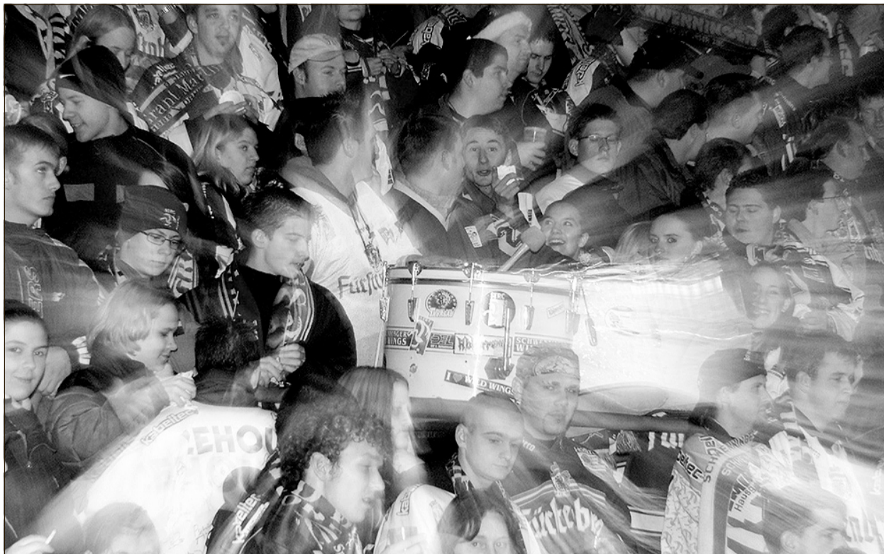
Tatort Bauchenbergstadion: Die Wild-Wings-Fans jubeln, im Schlussspiel fällt ein Schuss. Nun ist Ermittler Hummel dran.